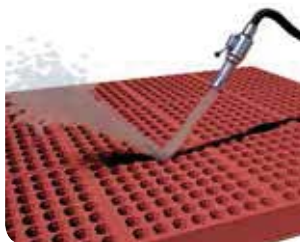
Dagelijks met water en zeep schoonspuiten