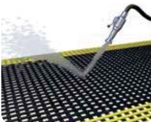
Dagelijks met water en zeep schoonspuiten